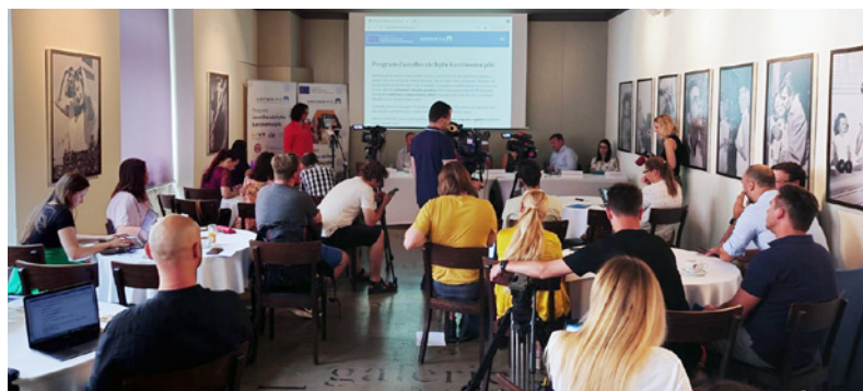
Tisková konference k zahájení projektu